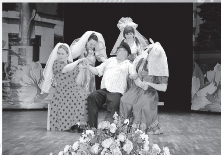
Центр культуры и досуга «Родонит» п. Боровский, ул. Октябрьская, 3