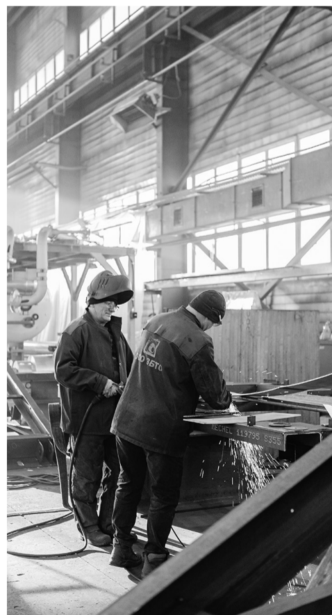
Сотрудники ЗБТО, занятые работой