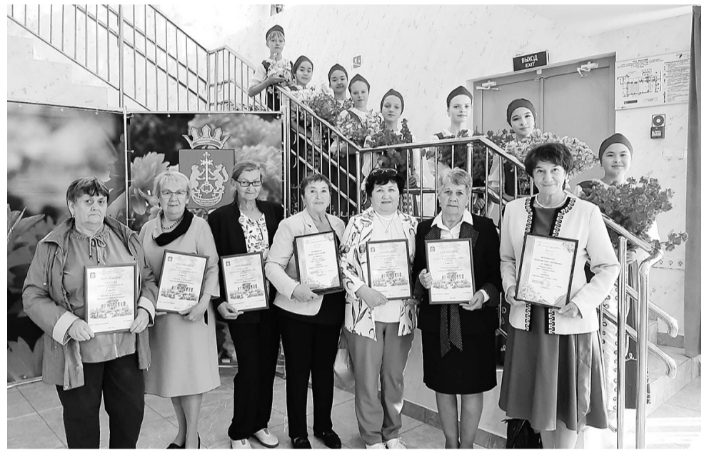
Победительницы районного конкурса