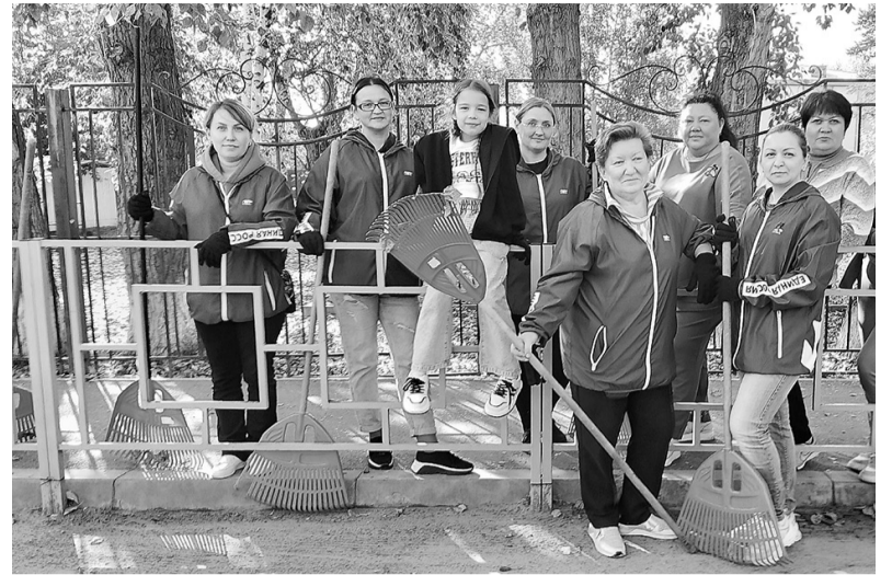
Сотрудники Администрации на субботнике

Администрация муниципального образования посёлок Боровский